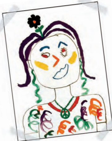
"Sin título" por Stacey Wilson, atrofia muscular espinal

Estos son tiempos interesantes y desafiantes para la política nacional del cuidado de la salud. Trabajando juntos, podemos hacer que se escuche nuestra voz a favor de nuestros hijos y todas las personas afectadas por una discapacidad.