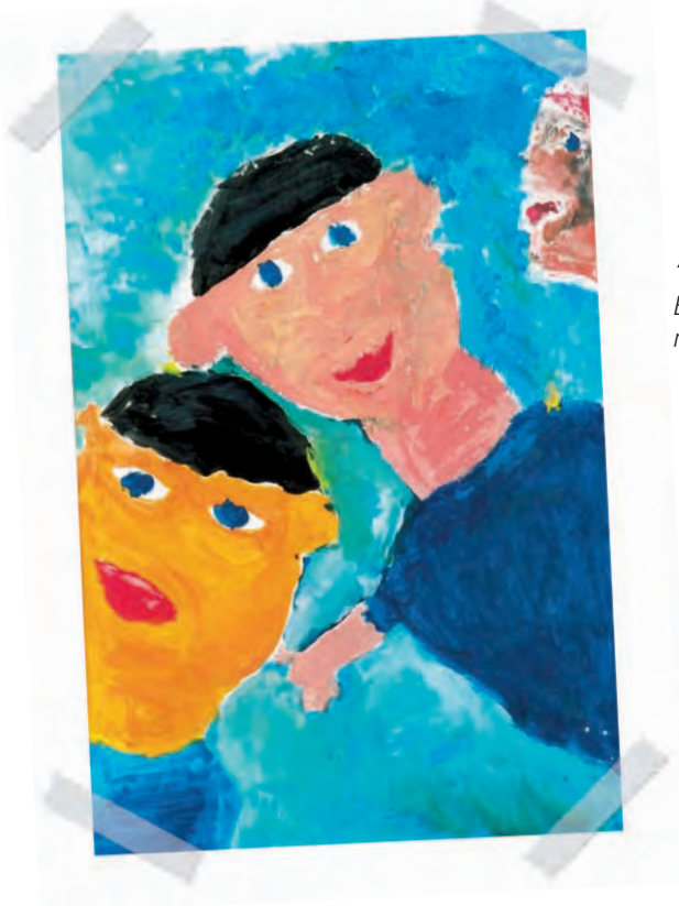
“Amigos” por Troy “T.C.” Blackburn, distrofia muscular de Duchenne

El negar los sentimientos tiene las dolorosas consecuencias de privarlo del valioso apoyo que le brindan sus amistades y los que le quieren, apoyo sumamente importante para ayudarlo a enfrentar este momento. La negación tiene como efecto el construir una pared entre usted y los demás — especialmente entre usted y su familia, entre usted y el niño que ama. Ese niño sentirá que usted está