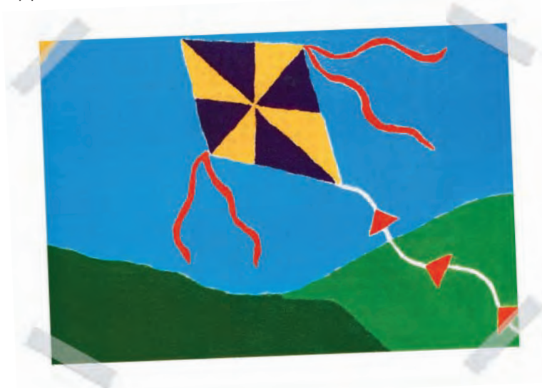
“Libre para Volar” por Julia Lee Sanders, distrofia muscular congénita

Los hermanos y hermanas de un niño con una enfermedad neuromuscular deben sentir que sus necesidades también son importantes. Deben ayudar al niño enfermo sin privarse de actividades al aire libre. Sus otros niños probablemente experimentarán sentimientos de culpa por ser “normales” cuando su hermano no