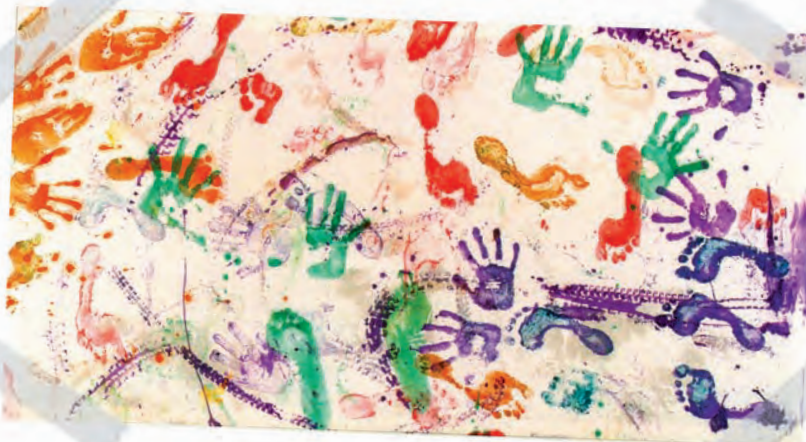
"Arte Rodante", por campistas de verano MDA

El esposo y la esposa probablemente se enfrentarán a reacciones emocionales diferentes con respeto a la enfermedad de su niño. Si la enfermedad ha sido transmitida mediante un gene defectuoso