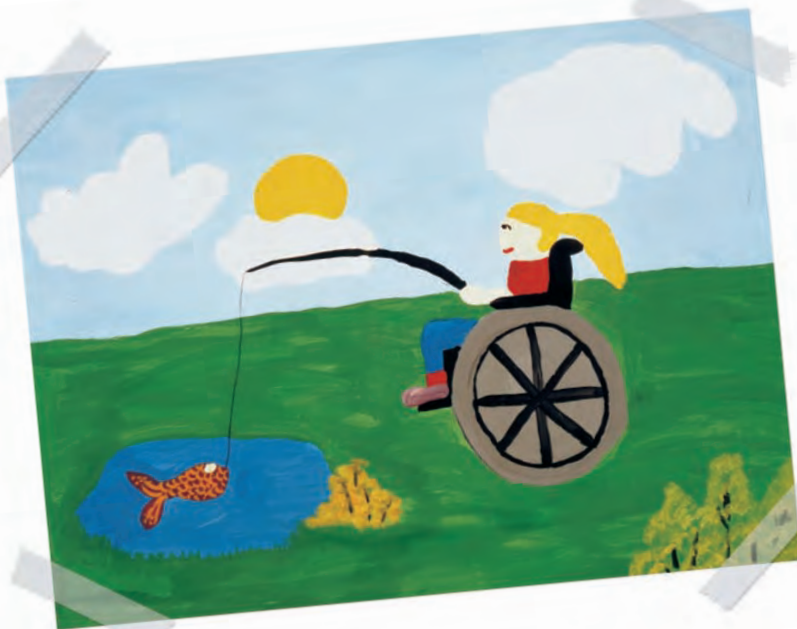
"Pescando" por Shawna Borman, atrofia muscular espinal 2

Otras personas se defienden con otro tipo de distorsión — un enojo mal dirigido. Se pueden enojar con el médico que hizo el diagnóstico o los médicos que no lo hicieron antes. Este enojo puede estar dirigido a un mundo, a un universo en el cual una enfermedad así puede afectar a un niño, o incluso contra un ser supremo que permite que ocurra una tragedia de este tipo.