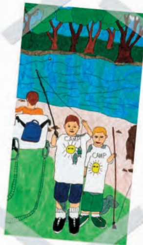
“Compañeros de Pesca” por Samuel Williams, enfermedad de Charcot- Marie-Tooth

Una forma de apoyar la profunda necesidad de autosuficiencia es asegurarse que los niños pasen tiempo de calidad con un modelo adulto masculino